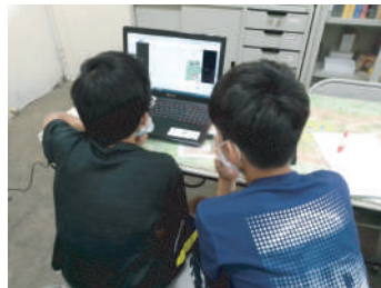
疫情下的網路學習 ▲

除基礎的學科課輔之外，也有兩性關係、自我探索、親子活動、3D列印、法律常識、社區服務、視訊學習等全人教育課程，以健康正向的方式把壓抑的生命釋放出來。