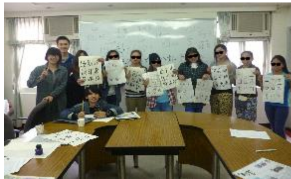
政大服務學習學生與移工互動

與政治大學的跨系所的服務學習課程合作，持續8年共76名學生參與，可以看到本地學生透過服務學習的參與，更加瞭解移工的生活文化風俗，以及獨特而充滿意義的生命故事。