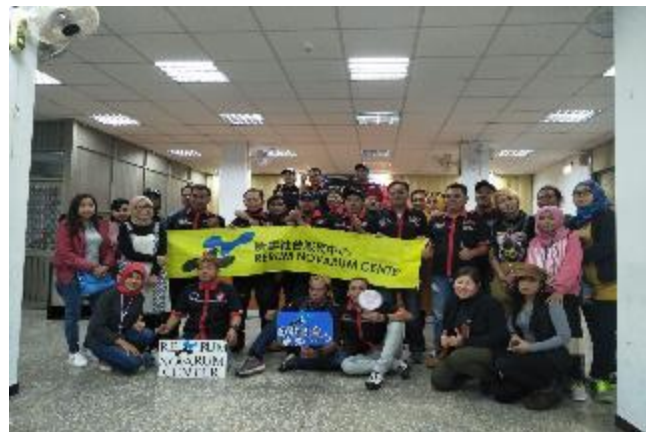
對移工團體進行權益宣導