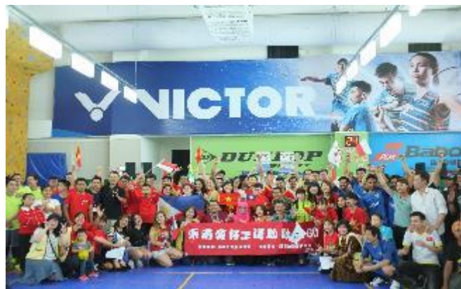
東南亞移工運動會

本中心承辦20多場移工文化活動，讓各國移工在母國具又意義節日時，撫慰思鄉之情並能讓台灣民眾更瞭解母國的風俗文化，辦理移工運動會共250人參加，經由移工與民眾一起組隊進行運動賽事，促進多元文化的友善運動空間，同時透過各國的才藝表演和家鄉美食作為跨國多元文化的交流並彼此接納。