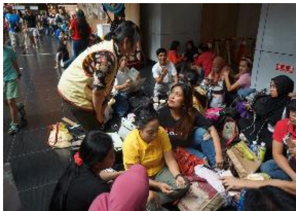
台北火車站宣導移工權益