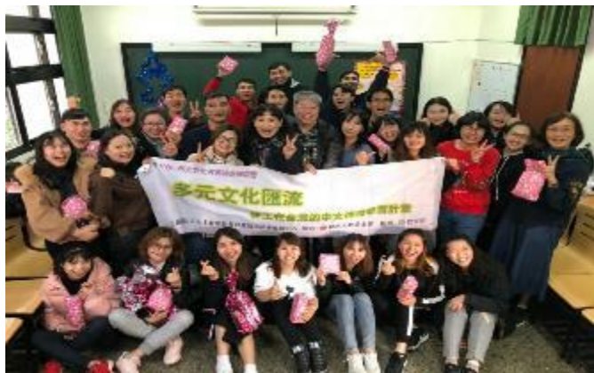
輔大神學院中文班