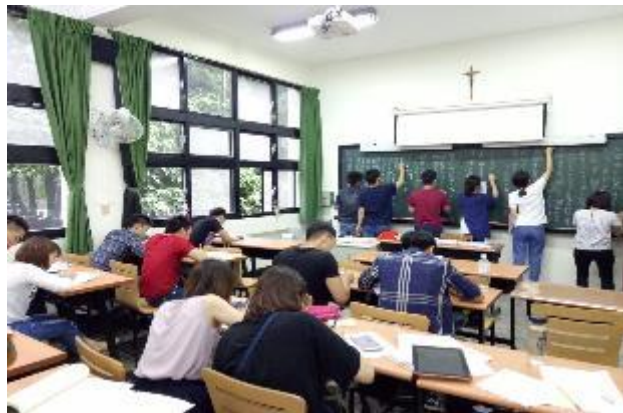
輔大神學院移工中文班

歷年來本中心協助20,529人次的移工相關權益諮詢，以及深度開案服務共780位移工，移工不論在何地都可以使用電話或通訊軟體向雙語專員進行諮詢或求助，也協助移工向雇主或仲介進行雙向溝通，避免因溝通不良而產生的勞資爭議。中心舉辦移工各項訓練課程、宣導活動及支持性團體共計有22,017人次參加，除了增加移工技職能力之外，也提供移工在放假休息時，能有正向的學習和休閒機會。