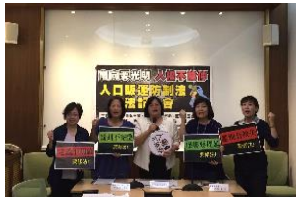
人口販運防制聯盟共同召開修法記者會

庇護中心歷年來提供103人次的人口販運被害人安置保護，運用社工專業提供個案管理服務及積極協助推動防制人口販運相工作，中心連2年獲得人口販運被害人保護團體的表揚，並參與人口販運防治監督聯盟，同時將這些陪伴及協助被害人的經驗整理，與人口販運防治監督聯盟的夥伴一起對相關議題進行倡議和推動人口販運防治法的修法，致力於推動人口販運的保護工作。