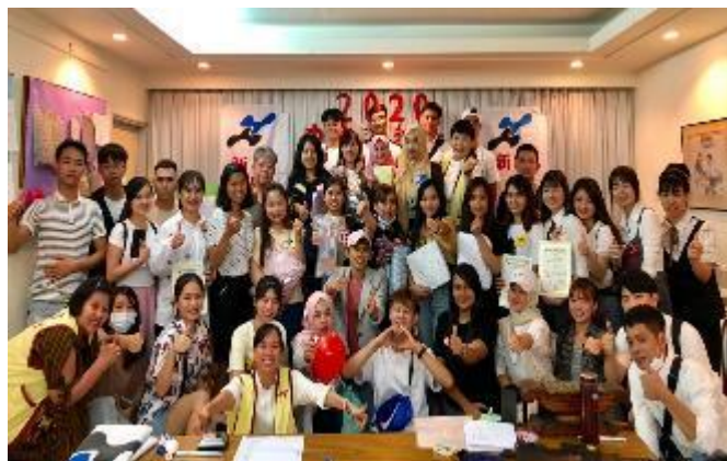
線上直播中文班-中文演講比賽

2020年新冠肺炎疫情嚴重影響到世界的每個角落，本中心因應防疫也暫停實體移工中文課程班，並且立即著手籌備中文線上直播課程，讓分佈在台灣各地的移工，用跨載具的線上學習方式，防疫又能安心學習不間斷，並於疫情較緩和之時，舉辦實體的演講比賽，移工學員們用順暢的中文分享許多自身的經歷、彼此鼓勵，不僅讓我們看到每個學員都是非常的努力學習，深受他們演講的故事而感動，也看到經過這段時間的學習，每位學員都收穫滿滿。